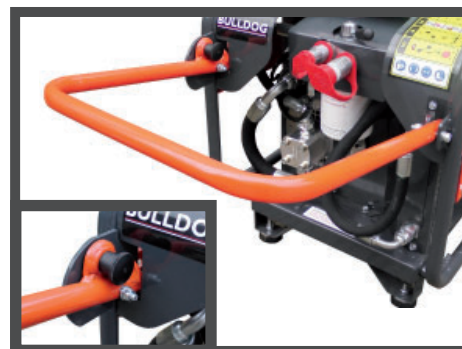
Manico pieghevole con blocco automatico