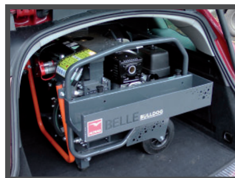
Portatile e compatto – Facile da trasportare