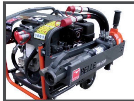
Rastrelliera amovibile – disponibile come optional (martello e punte non incluse)

OPH/13/DIO Rastrelliere amovibile (arancione)